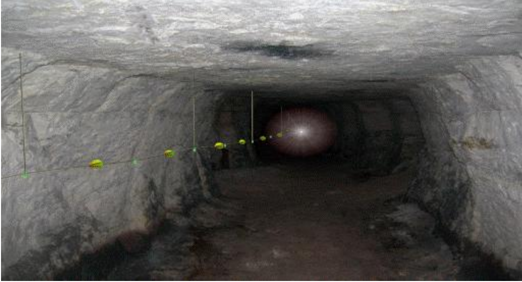
Şekil-1: Hayat hattı görünümü

18. (Ek:RG-10/3/2015-29291) (3) Yeraltı madenlerinde, hazırlık faaliyetlerinin yapıldığı alanlar ve üretim panoları gibi yeraltı maden işletmesinin bütün bölümlerini kapsayacak şekilde ve çalışanların yerüstüne çıkmalarını kolaylaştıran; yanmaya, kopmaya ve aşınmaya karşı dayanıklı bir hayat hattı kurulur (Şekil-1 ve Şekil-2). Bu hatlar acil durum planlarına uygun olarak yerleştirilir.